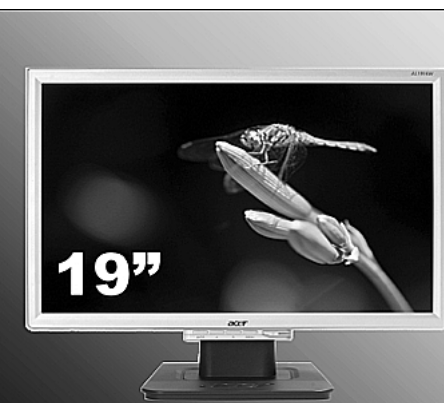
Монитор Acer AL1916WAs 19" WIDE, 5ms, 1440 x 900

ЮВЕЛИРНАЯ МАСТЕРСКАЯ «АУРУМ» открылась по адресу ул. Дружбы, 29-а на втором этаже торгового центра «Купец» (ремонт любой сложности и изготовление ювелирных изделий).