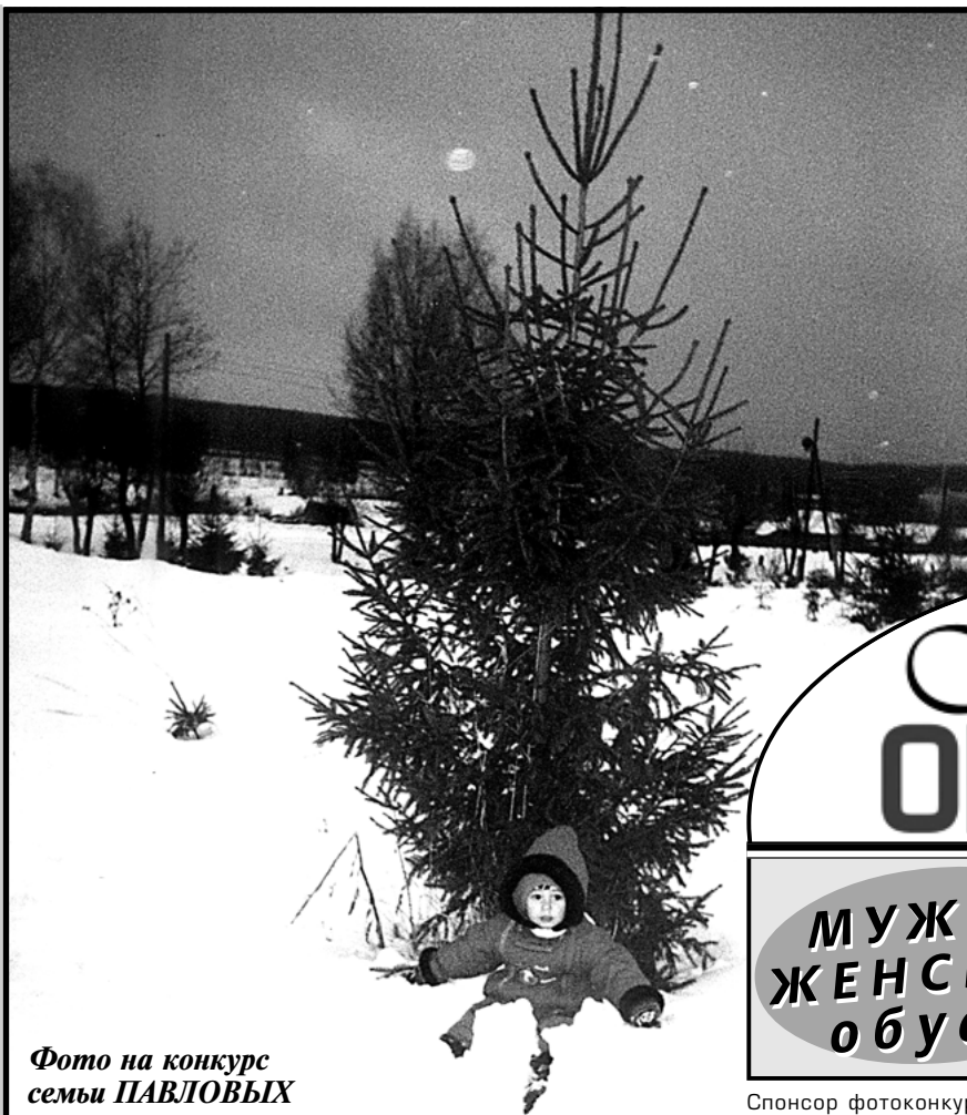
Фото на конкурс семьи ПАВЛОВЫХ

Спонсор фотоконкурса * на правах рекламы