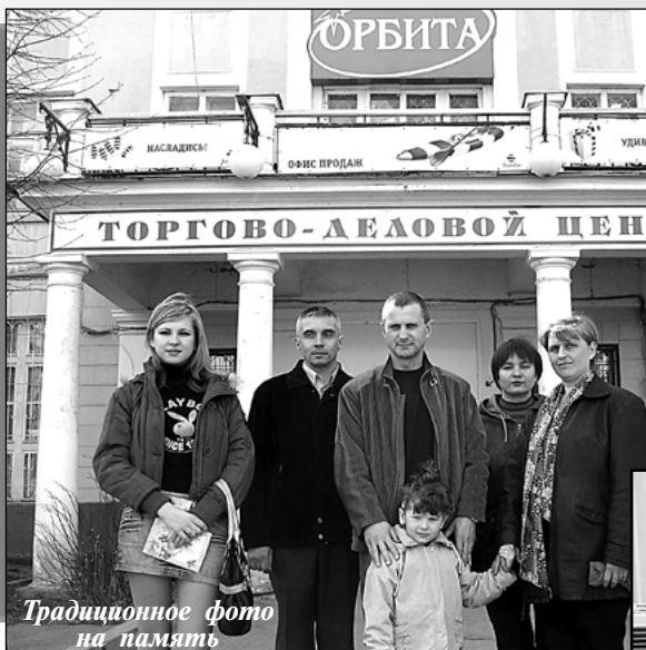
Традиционное фото на память