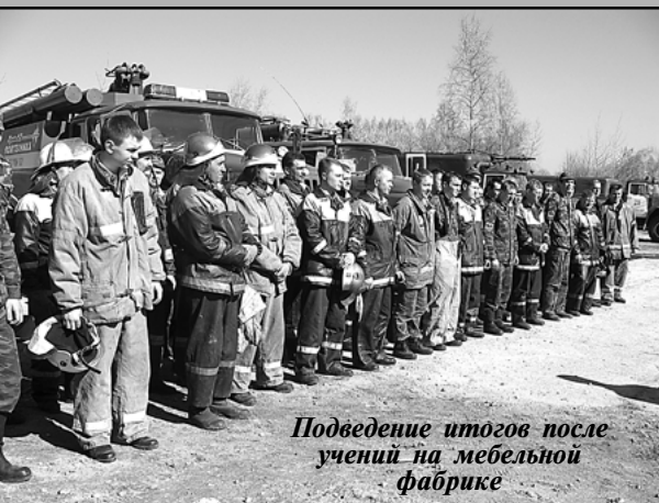
Подведение итогов после учений на мебельной фабрике