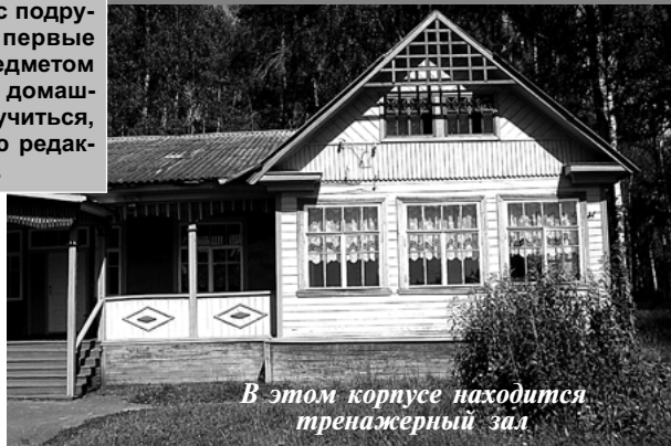
В этом корпусе находится тренажерный зал

Моя детская мечта не просто рассыпалась,