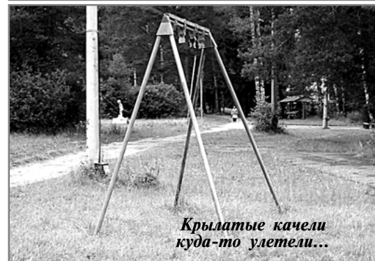
Крылатые качели куда-то улетели...

чишки бросились на штурм ворот соперника. Чем занимались девочки, я уже не увидела - уезжала из лагеря, но думаю, что тренерам хватило души, сердца, необходимых слов, для того, чтобы сгладить первое впечатление.