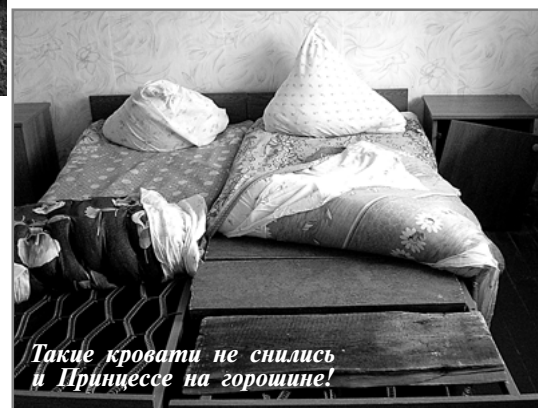
Такие кровати не снились и Принцессе на горошине!