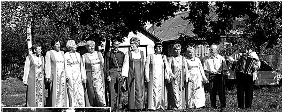
Выступает ансамбль «Россиянка»