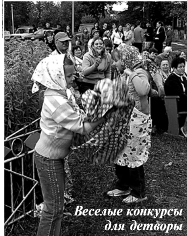
Веселые конкурсы для детворы