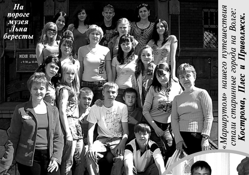
На пороге музея Лына Бересты