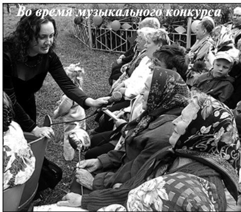
Во время музыкального конкурса