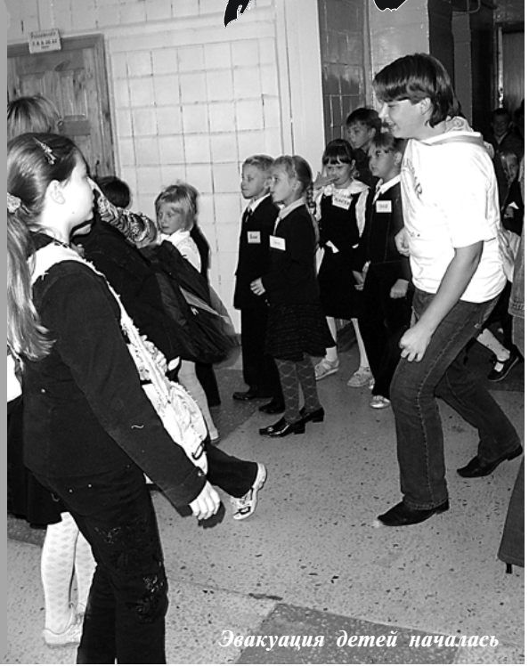
Эвакуация детей началась

На начало учебного года в нашем районе традиционно приходятся учения в образовательных учреждениях, проводимые Кольчугинским ОГПС. Сегодня пожарной безопасности школ отводится большое внимание уже на стадии подготовки зданий школ к учебному году, ну, а дело пожарных - проверить умение педагогов и ребят действовать во время пожара. Кроме того, подобные мероприятия призваны выявить слабые места в действиях самих пожарных. Учитывая, что конечный результат всех вышеперечисленных проверок направлен на обеспечение безопасности наших детей, сентябрьские срывы уроков в школах города не осуждались ни педагогами, ни детьми. Последними даже приветствовались.