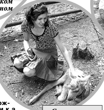
С маленьким лосенком

А наутро, плотно позавтракав, мы отправились в Плес – в Дом-музей ху-