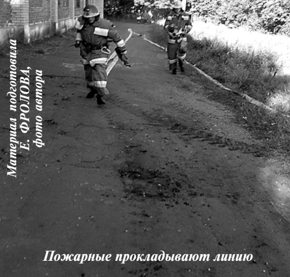
Пожарные прокладывают линию

Материал подготовила Е. ФРОЛОВА