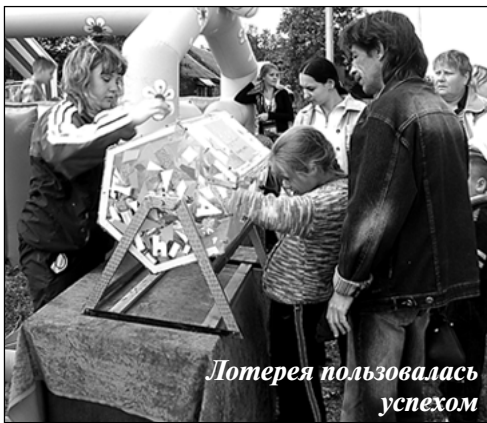
Лотерея пользовалась успехом