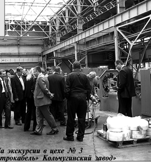
На экскурсии в цехе № 3 ОАО «Электрокабель» Кольчугинский завод»