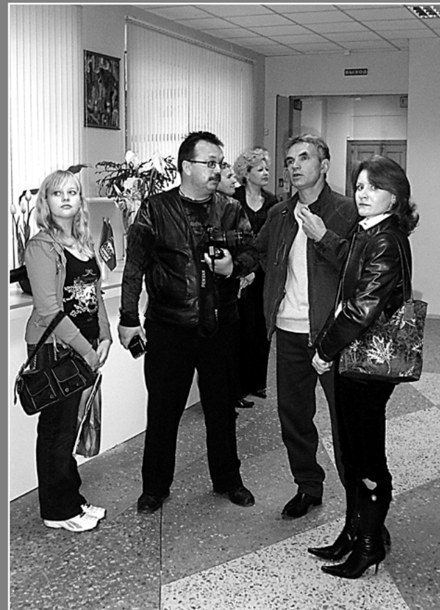
Фотхудожники активно общались на открытии выставки - шаг к фотообъединению сделан!

курсами. Я очень хотела бы, чтобы успешно прошло десятилетие клуба «Росток»: оно отмечается в следующем году, но это наш творческий сезон. Картинная галерея очень тесно работает с этим клубом, поэтому мы ждем от художников новых работ, а они, в свою очередь, готовятся к своему, пусть небольшому, но юбилею. Очень много интересного мы ждем от нашей Детской школы искусств, которая всегда нас заражает новыми идеями, новыми задумками. А в конце года у нас пройдет замечательный фестиваль «Колосок»: в его организации, надеюсь, как всегда нам поможет Кольчугинский хлебокомбинат. Обязательно пройдут новые эскурсии, новые встречи. Состоятся новые концерты артистов в Музыкальной гостиной. От них мы тоже ждем много интересного: артисты обновили свой репертуар, и кольчугинцы успели их полюбить. И все это пройдет в рамках проекта «Кольчугино - город Мастеров».