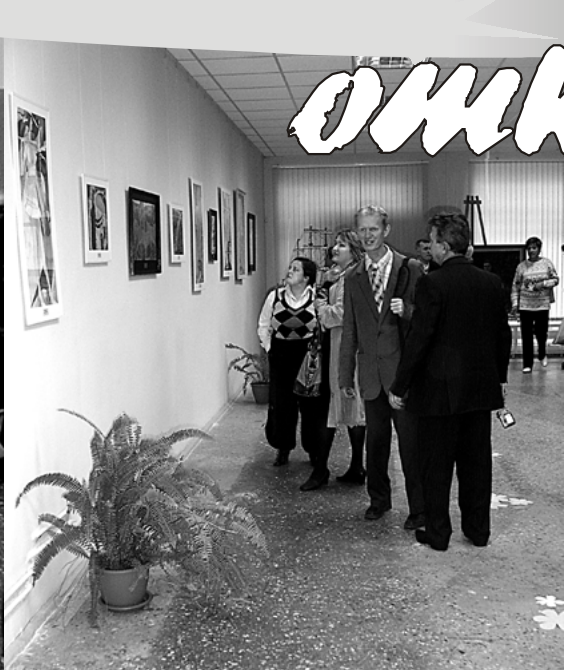
Выставка просто притягивает зрителей.