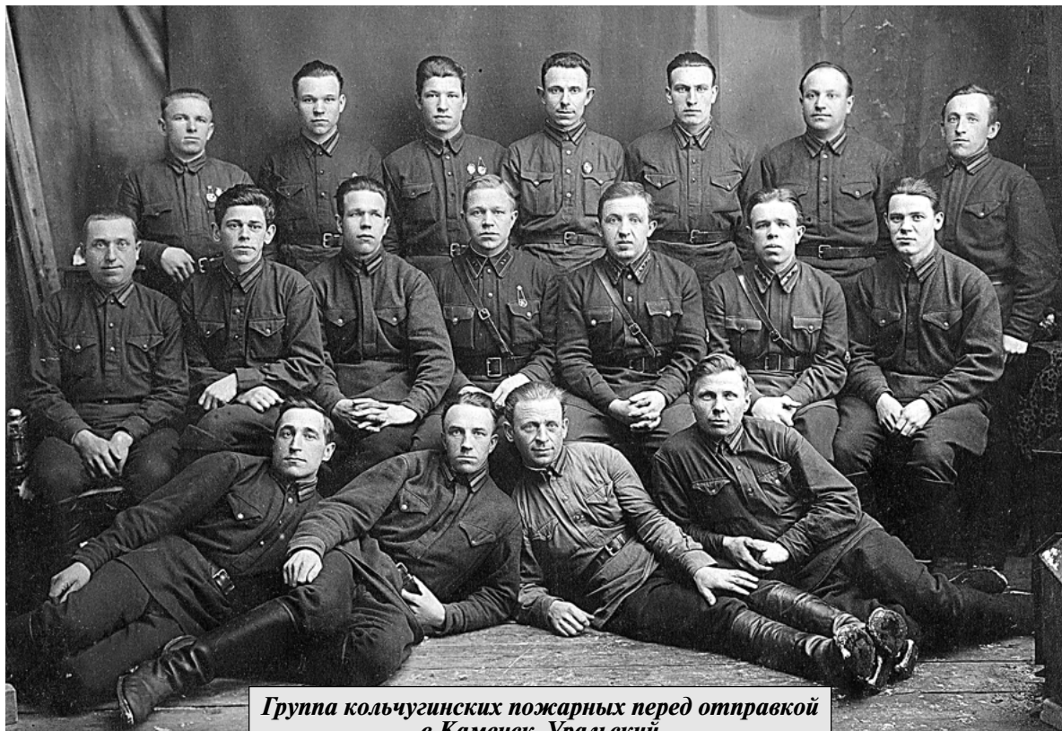
Группа кольчугинских пожарных перед отправкой в Каменск-Уральский