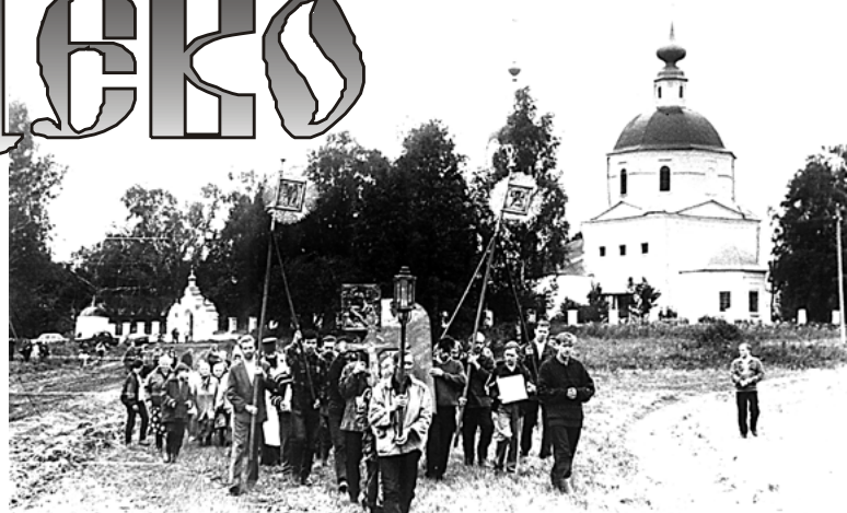
Крестный ход в селе Флорищево, посвященный 2000-летию Рождества Христова. 20 августа 2000 год

Таких крестных ходов было пять. Так, например, в День святой Троицы крестный ход совершался в деревню Левашово, самую большую в приходе после Флорищева, во избавление от разных неожиданных бед в летний период. В эту же