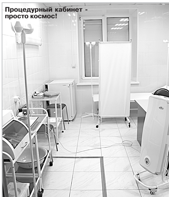
Процедурный кабинет - просто космос!