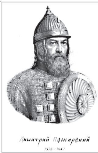
Дмитрий Пожарский 1578-1642