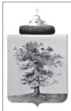
Герб князей Стародубских

Известно, что в XVII веке селом владел не просто знатный человек, а еще и государственный деятель – знаменитый князь Д.М. Пожарский, герой Отечества. Читатель со школы помнит, что он – защитник страны, освободитель Москвы от поляков в Смуту. А еще князь Пожарский – один из тех, кто подписал Грамоту об избрании в 1613 году нового царя на российский престол – Михаила Романова.