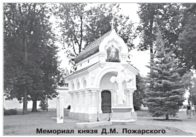
Мемориал князя Д.М. Пожарского

В конце XVII века Тютково относилось к дворцовой волости.