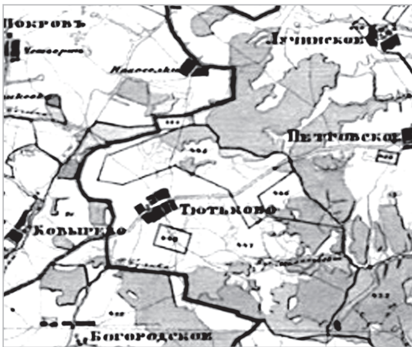
Юрьевский уезд, 1850 год

В государстве на несколько лет растянулись Смутные времена. А затем в стране начинаются перемены, в которых участвует наш будущий вотчинник. Князь не признал боярское правительство (Семибоярщину). В январе 1611 года образовалось первое народное ополчение из русских людей, не согласных с решением этого правительства призвать на Московский трон польского королевича, сына Сигизмунда. К рязанскому отряду, чтобы «стали за... веру и за Московское государство заодно», присоединился отряд воеводы Зарайска князя Дмитрия Пожарского. И это ополчение отправилось на Москву.