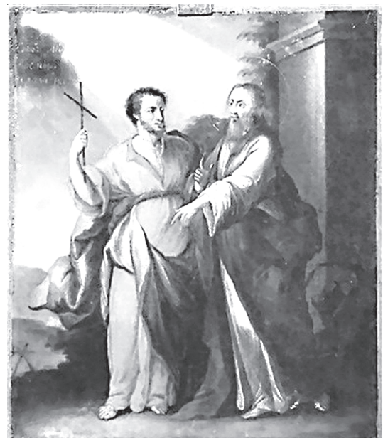
Икона святых Космы и Дамиана

Память Космы и Дамиана в церковном календаре отмечается 1 ноября по старому стилю. Именно в этот день после полного завершения всех сельскохозяйственных работ начинался учебный год в церковно-приходских школах. Вот таким образом Косма и Дамиан стали ассоциироваться с народным образованием. Этим святым молились о прозрении разума к учению грамоте. Именно как покровители образования на иконе и представлены великие рус-