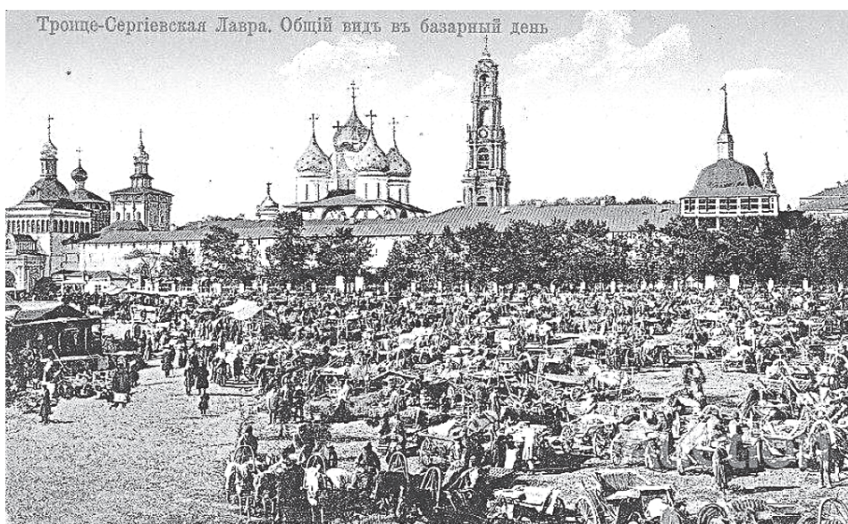
Троице-Сергиевская Лавра. Общий вид в базарный день

В Сергиевом Посаде наши паломники встретили своих земляков – группу певчих московского Казанского храма, где старостой являлся отец Вани Шмелёва. Они сообщили, что обратно «поедут отсюда на машине (то есть на поезде. - Прим. автора) – к Боголюбской в Москву спешат: петь надо, подрядились». Праздник в честь Боголюбской (Московской) отмечается 18 июня старого стиля. Этот день особо почитался москвичами, у чудотворного образа Божией Матери «Боголюбская» в часовне у Варварских ворот в этот день служился молебен с большим