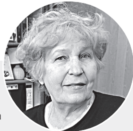
Материал подготовила Надежда Александровна ДУБРОВИНА