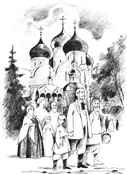
Иллюстрация к повести Богомолье

«Повесть «Богомолье», хотя и написана Шмелёвым раньше романа «Лето Господне» и структурно стоит отдельно, но является как бы продолжением, вернее, даже составной частью романа. И если бы она структурно входила в роман, то стояла бы в разделе «Праздники – Радости» после главы «Петровками». В романе «Лето Господне» действие происходит с весны 1879 года (точнее с 13 февраля, это Чистый понедельник, или первый день Великого поста) по ноябрь 1880 года.