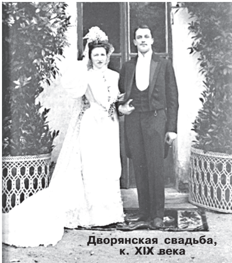
Дворянская свадьба, к. XIX века

рославском было 30, в деревне Шишлиха стало 16 дворов. Появилось описание местоположения нашего села: «в Давыдовской волости, от Юрьева в 15 верстах. На Строминском торговом тракте из г. Юрьева в г. Москву (через г. Киржач) по левой стороне тракта». Жизнь в нашем селе после реформы проходила так же, как в любом соседнем селе. Образовались «отходники». Некоторые семьи покидали село навсегда. К 1895 году в селе осталось 155 человек.