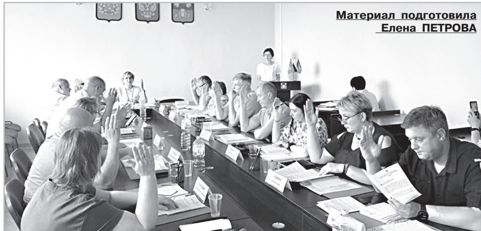
Материал подготовила Елена ПЕТРОВА

О дорожной деятельности в 2026 году доложил руководитель управления благоустройства и дорожного хозяйства Н.Н. КАРНАУХОВ. Но начал он с прошлого года, по его словам, в рамках государственной программы «Дорожное хозяйство Владимирской области» в 2025 году на ремонт автомобильных дорог было выделено 98,6 миллионов рублей (92,9 из области). Выполнен ремонт дорог и тротуаров общей протяжённостью 8 км 692 м. У 68 деревьев были удалены кроны. В целях безопасности были приобретены 1380 светоотражающих браслетов, для последней передачи ученикам начальных и средних классов. Исполнены муниципальные кон-