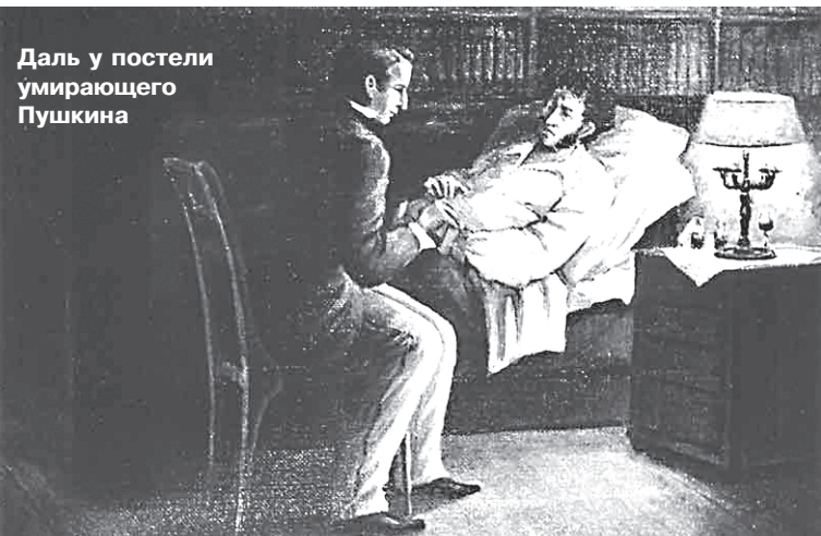
Даль у постели умирающего Пушкина

А рассказать сегодня читателю хочется об одной уникальной в своём роде иконе. Это образ святых Космы и Дамиана Асийских. Косма и Дамиан по церковному преданию – два брата, врачеватели и чудотворцы, предположительно жившие во второй половине III – начале IV веков. Братья были христианами, получили дар исцеления и прославились как искусные врачи-бесребрники.